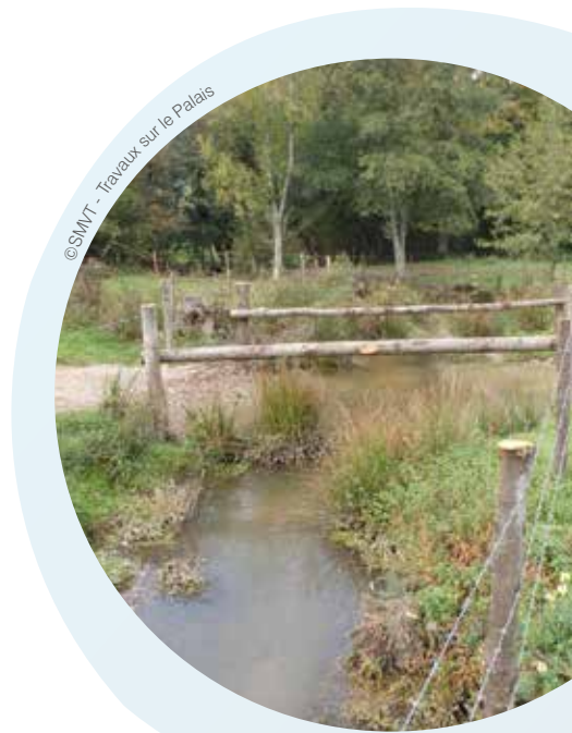
Travaux sur le Palais

L'étude, qui devrait être lancée d'ici la fin de l'été, permettra d'identifier les évolutions des structures actuelles et les décisions qu'elles seront amenées à prendre.